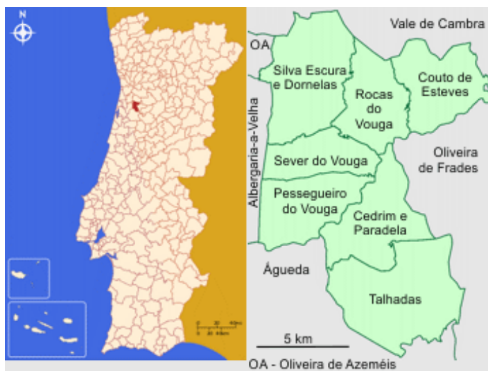
Mapa do Concelho

O concelho de Sever do Vouga é constituído por 7 freguesias, identificadas no mapa abaixo. As freguesias de Cedrim e Paradela, bem como de Silva Escura e Dornelas, foram objeto de agregação, pelo que são Uniões de Freguesias.